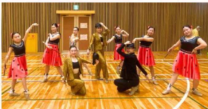
ナゴヤゴールドデントワラーズHP

バトンは新体操やフィギュアスケートに比べてメジャーなスポーツではありませんが近い将来、オリンピックの正式種目になる日を待ち望んで努力しています。