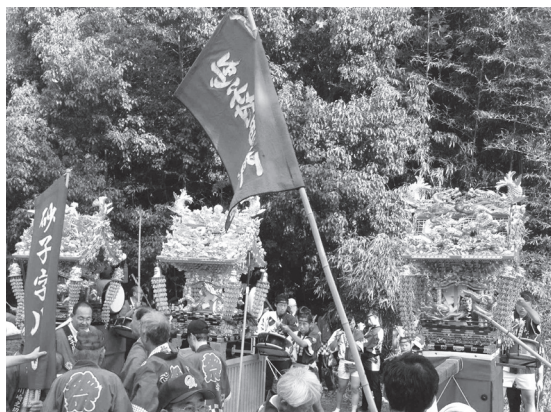
砂子秋まつりでの「神楽太鼓」演奏の様子

主催 地域伝統芸能まつり実行 委員会、一般社団法人地域創造 後援 総務省、文化庁、観光庁、 NHK 協力 名鉄観光サービス株式会社