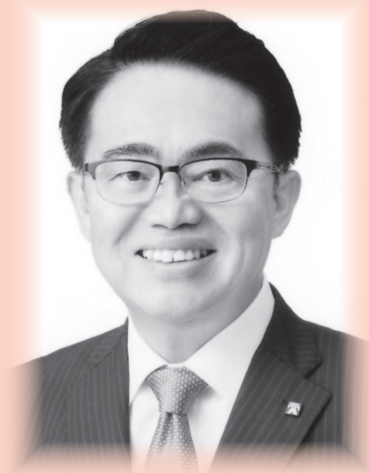
愛知県知事 大村 秀章