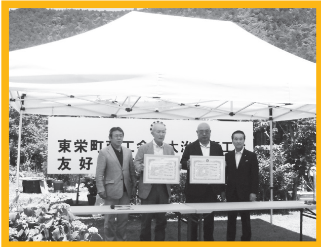
東栄町商工会との調印式 (東栄町奥三河紅葉園)

その中で、町同士の交流から商工会、商工会議所の交流にも繋がり、友好交流協定が締結されました。協定締結により、さらなる交流と商工業の発展、地域振興が期待されます。