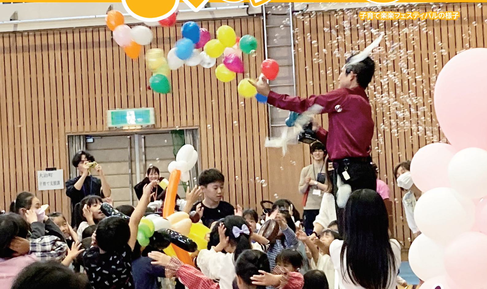
子育て楽楽フェスティバルの様子

●バルーンショーや親子手遊びなどイベント盛りだくさん！ みんなで楽しい時間を過ごしました。