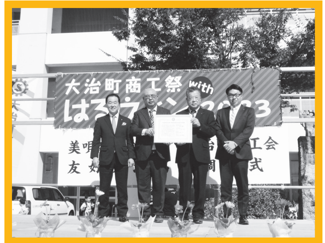
美唄商工会議所との調印式 (大治町商工祭withはるウィン)