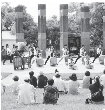
戸田川緑地で開催された「初夏のものがたり」