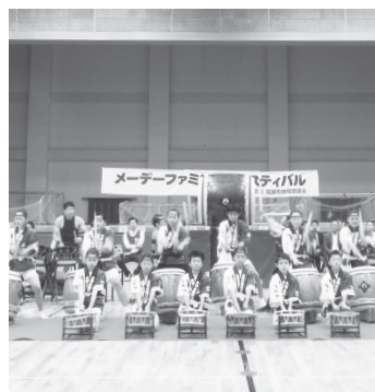
稲沢市で開催された「メーデーファミリーフェスティバル」