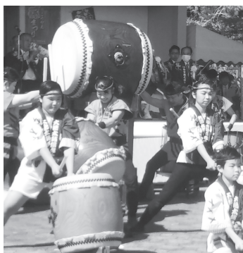
曼陀羅寺で開催された「江南藤まつり」