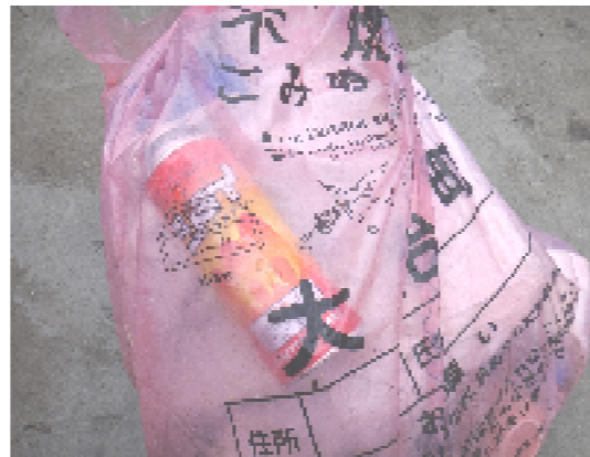
不燃ごみ袋にスプレー缶が入っています。

スプレー缶、ライター、乾電池を不燃ごみなどに入れないでください。 収集車の火災の原因となり、大変危険ですので、資源の収集日に専用かごに入れてください。