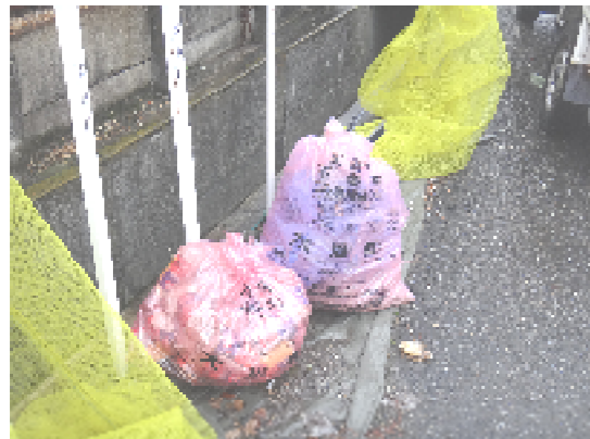
可燃ごみ置場に不燃ごみが出ています。

町で指定した収集場所、収集日以外にごみを出さないでください。 ごみが散乱するなど周囲に迷惑がかかります。 ※収集場所等は下欄で再確認を！