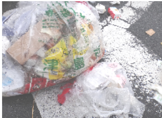
他の自治体の袋です。

レジ袋や、他の自治体のごみ袋などに入れないでください。 町指定の専用袋に入れて出してください。