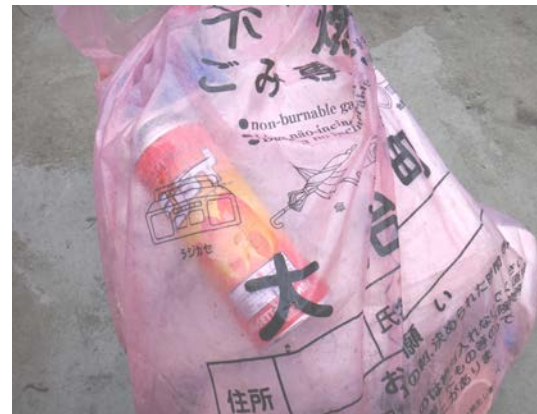
不燃ごみ袋にスプレー缶が入っています。

スプレー缶、ライター、乾電池を不燃ごみなどに入れないでください。 収集車の火災の原因となり、大変危険ですので、資源の収集日に専用かごに入れてください。