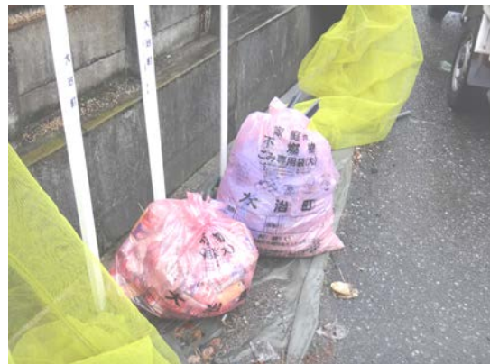
可燃ごみ置場に不燃ごみが出ています。

町で指定した収集場所、収集日以外にごみを出さないでください。 ごみが散乱するなど周囲に迷惑がかかります。 ※収集場所等は下欄で再確認を！