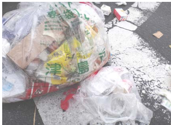
他の自治体の袋です。

レジ袋や、他の自治体のごみ袋などに入れないでください。 町指定の専用袋に入れて出してください。