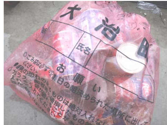
不燃ごみ袋に缶やビンが入っています。

可燃・プラ・不燃・資源物を混ぜた状態で出さないでください。 それぞれをきちんと分別し、定められた方法で出してください。