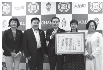
▲村上町長・横井副町長と一般社団法人ハッピートークアカデミー協会の皆さん

一般社団法人ハッピートークアカデミー協会は「話し方・コーチング・脳の働き」を組み合わせたハッピートークトレーニングを町内の小学校をはじめ海部地域の小中学校で行っており、優れた教育支援活動として評価されました。