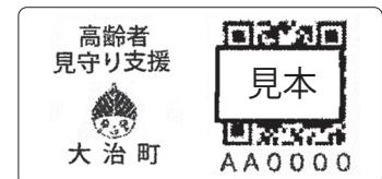
見守りラベル・シール