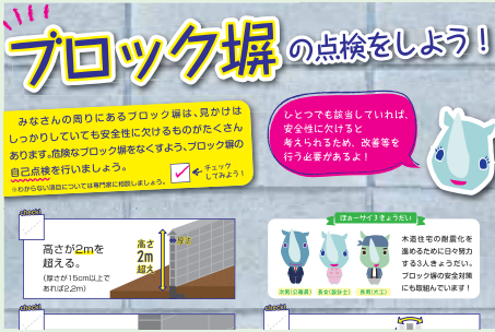
チェックリストはこちらどうぞ