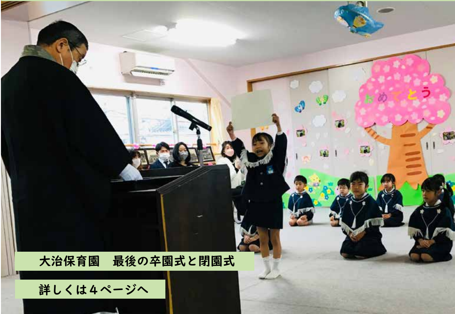
大治保育園 最後の卒園式と閉園式