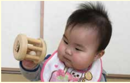
稲沢市で新生児にプレゼントされる「木のおもちゃ」

子どもの「木育」は、いま注目されている。森林環境譲与税を活用し、国産材で作った木のおもちゃに「はるちゃん」の焼き印を入れて、乳幼児にプレゼントしてはどうか。