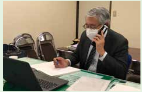
子ども応援本部での電話相談