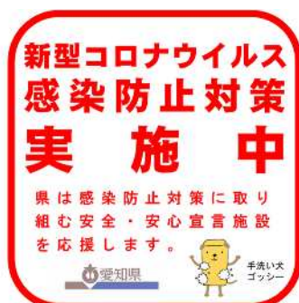
【PRステッカー イメージ】