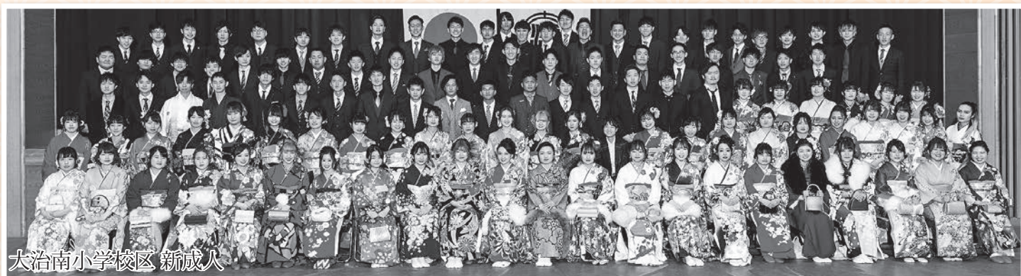
大治南小学校区 新成人