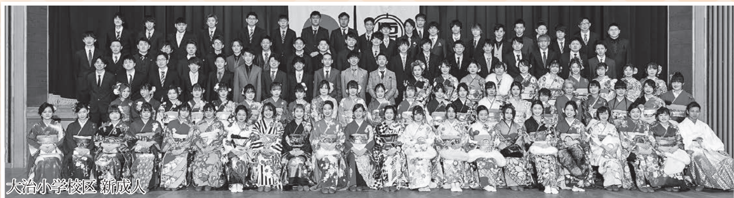
大治小学校区 新成人