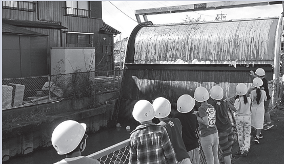
風船を用いた除塵機の操作実演

今回は大治西小学校の3年生を対象とし、排水機場内機械(ポンプ・操作盤等)の説明から海部農林水産事務所職員によるパネルや模型を用いた排水機場の仕組みの説明、風船を用いた除塵機の操作実演を行いました。