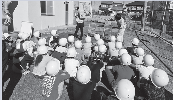
海部農林水産事務所職員によるパネルや模型を使った説明