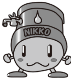
ニコマルくん 日光川下流域下水道 マスコットキャラクター

● 水洗便所改造資金融資あっせん 下水道に接続する工事資金の融資あっせんと融資に対する利子を補給(融資額60万円以内)