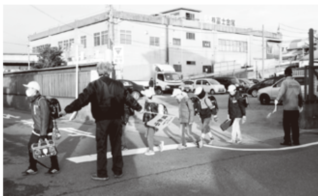
●交通安全啓発活動中の株式会社富士金属の皆さん