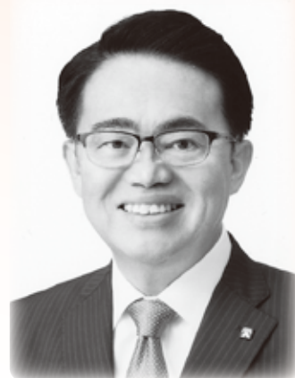
愛知県知事 大村 秀章

あけましておめでとうございます。 新たな年が、県民の皆様方にとりまして素晴らしい1年となりますよう、心からお祈り申し上げます。