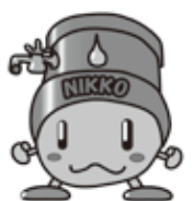
日光川下流域下水道 マスコットキャラクター 「ニコマルくん」