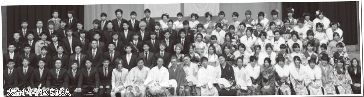
大治小学校区 新成人

また、私たちを見守ってくださった家族や地域の皆さん、指導していただいた先生方、共にここまで歩んできた多くの仲間—たくさんの支えのおかげで私たちの今があることに感謝しています。この感謝の心を忘れることなく、これからの未来を培っていききたいと思ひます。