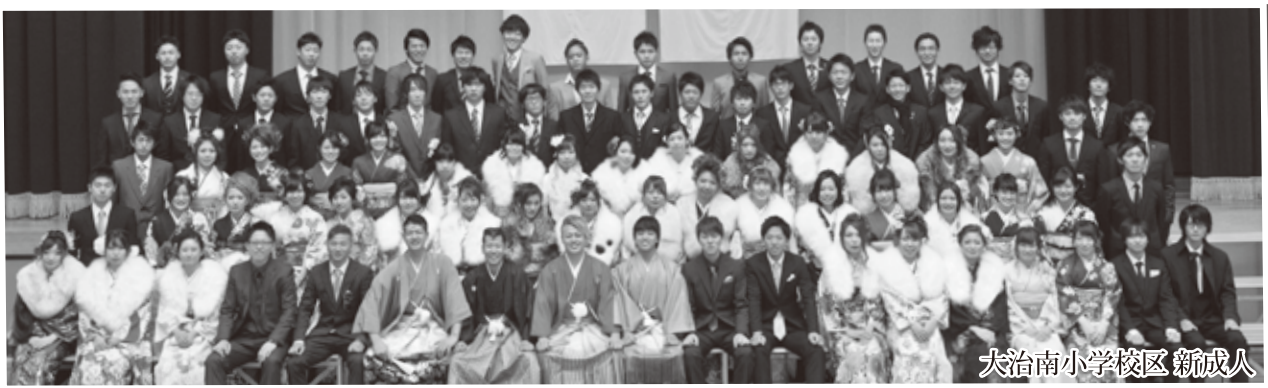
大治南小学校区 新成人