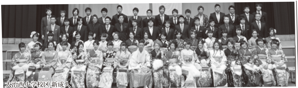
大治西小学校区 新成人