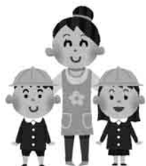
保育施設への送り迎え