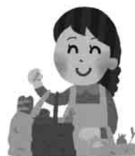
保護者が買い物などの外出時に子どもを預かる