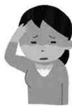
保護者の病気や冠婚葬祭など、急用時に子どもを預かる