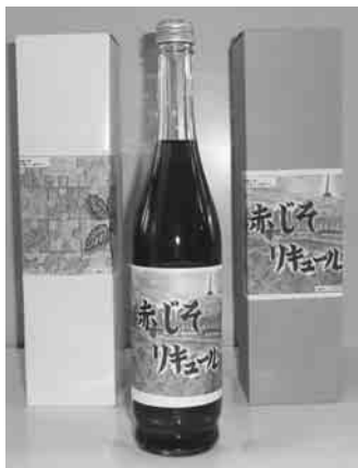
●赤じそリキュール