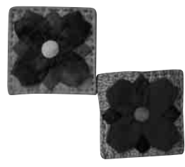
※見本は公民館にあります

日 時 9月29日(木) 午後1時30分~3時30分 申込受付は午後1時 場 所 公民館2階和室 教材費 500円(当日徴収) 対象者 町内在住・在勤の方 定 員