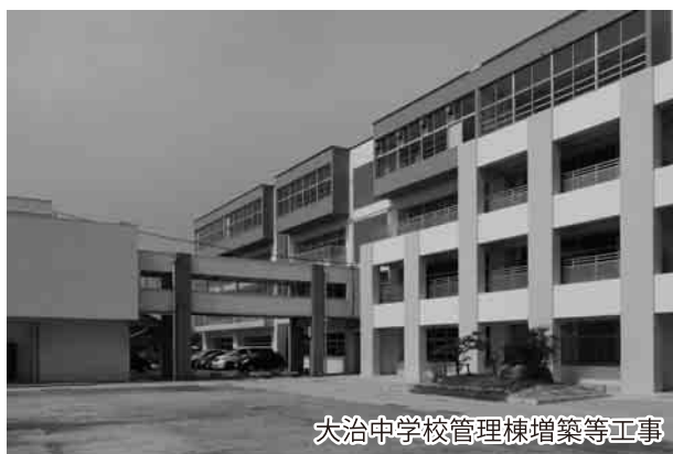
大治中学校管理棟増築等工事