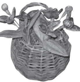
※見本は公民館にあります