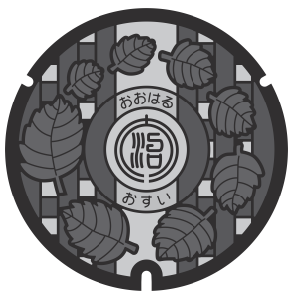
●大治町公共下水道デザインマンホール蓋

【例】受益者負担金対象の土地を200㎡(約60坪)所有している場合200㎡×270円=54,000円 ※3年以内の接続の場合は、20%減免します。 例の場合、10,800円減免となり43,200円です。