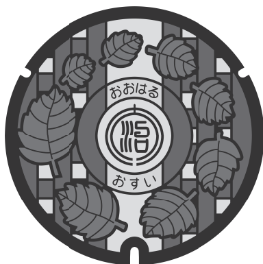
●大治町公共下水道 デザインマンホール蓋