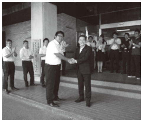
●出発前 町長からの激励

また、避難所ではペット持ち込み禁止となる可能性が高く、車中など個人での対応となるため、飼い主の方は日ごろの備えなど、ご理解ご協力をお願いします。