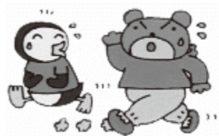
散歩・ウォーキング