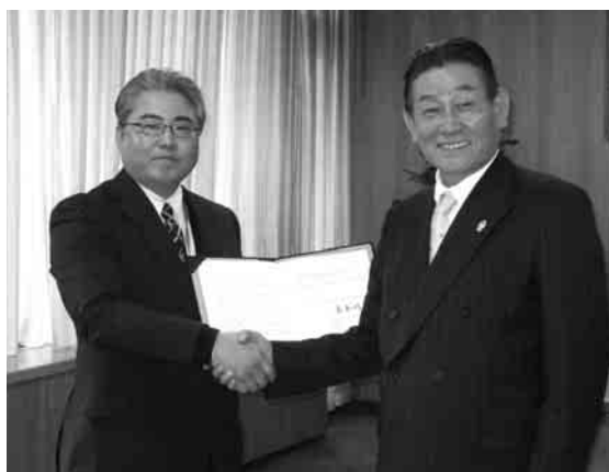
ユニー株式会社ピアゴ大治店との協定締結式の様子

今後も町民の皆さんの生命と財産を守り、安全で安心なまちを実現するため、一層の防災体制の強化に取り組めます。