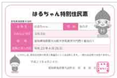
◀ 交付された特別住民票

はるちゃんは町長から「大治町PR大使」として任命され、「町の活性化とイメージアップのためお互いに頑張りましょう」と激励され、特別住民票を受け取りました。